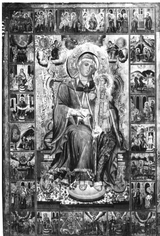
Сл. 10. Акатист на Пресвета Богородица, црква Св. Благовештение, Прилеп