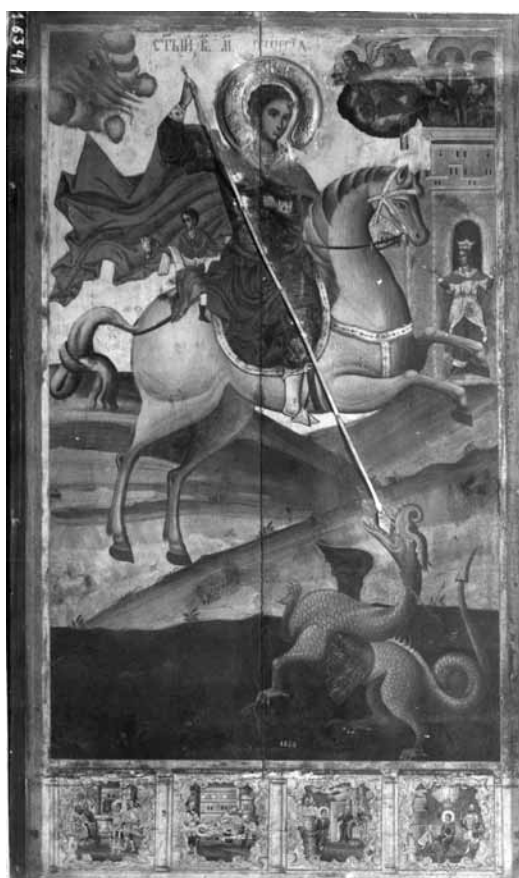
Сл. 4. Св. Ѓорѓи, црква Св. Благовештение, Прилеп