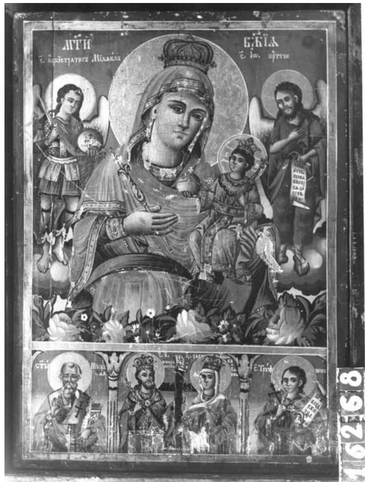
Сл. 14. Богородица со Христос, црква Св. Благовештение, Прилеп