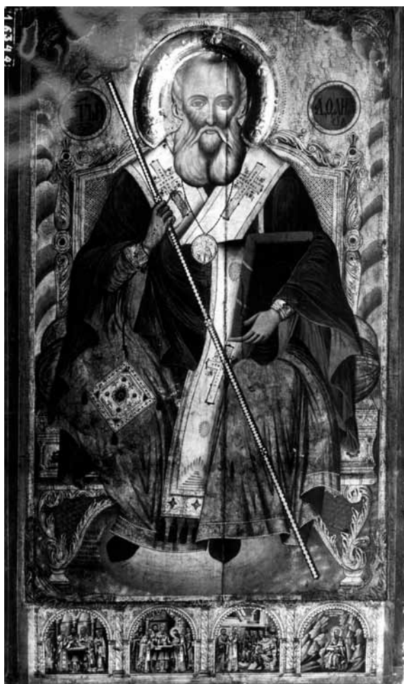
Сл. 1. Св. Атанасие, црква Св. Благовештение, Прилеп