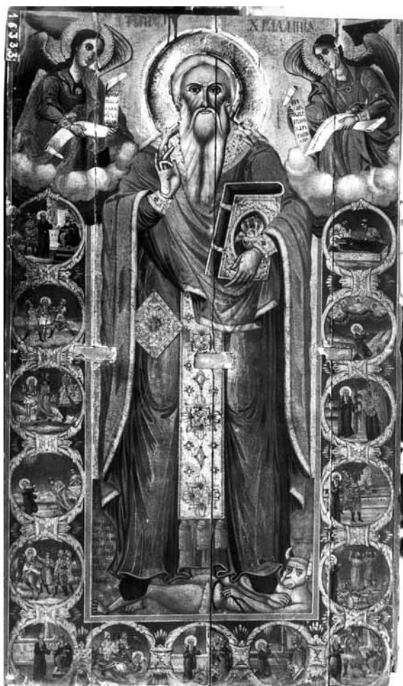
Сл. 9. Св. Харалампие, црква Св. Благовештение, Прилеп