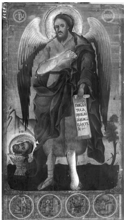
Сл. 7. Св. Јован Претеча, црква Св. Благовештение, Прилеп