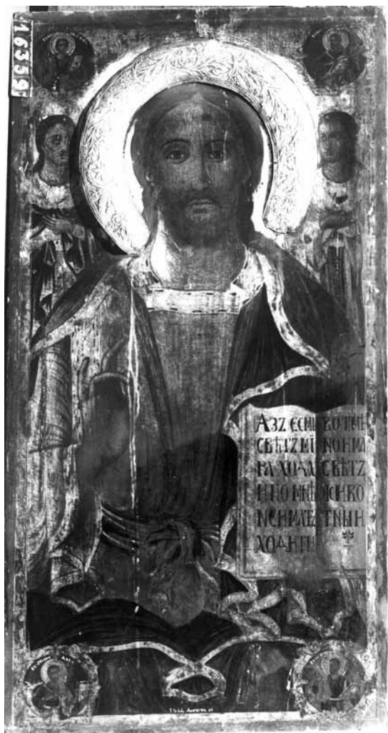
Сл. 15. Исус Христос, црква Св. Благовештение, Прилеп