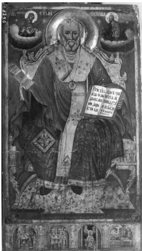
Сл. 3. Св. Никола, црква Св. Благовештение, Прилеп