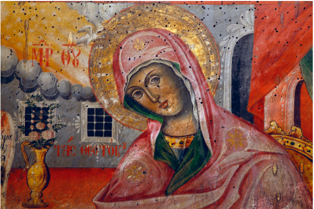
Сл. 18. Богородица, детаљ од иконата Благовештение, црква Св. Благовештение, Прилеп

Бкалдър/ мачѝи за вѣчни/ и спѡменъ : 1846.