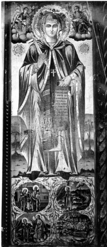
Сл. 13. Св. Петка, црква Св. Благовештение, Прилеп