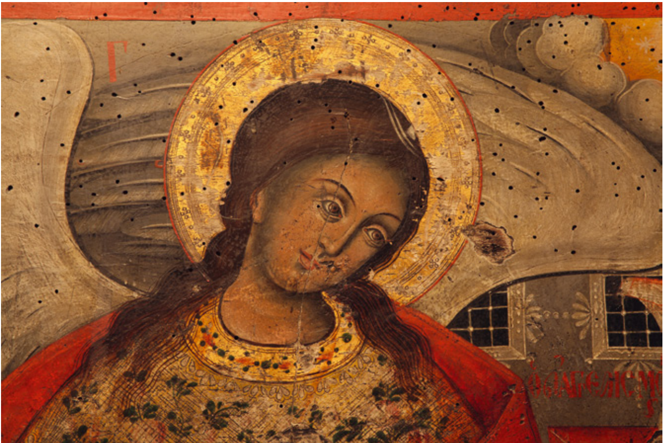
Сл. 18. Архангел Гаврил, детаљ од иконата Благовештение, црква Св. Благовештение, Прилеп

Во северниот параклис посебно внимание предизвикува една нерегистрирана икона на Благовештение (сл. 17) придружена од двајцата пророци Давид и Соломон од 1846 г. за која нема информации кога станала дел на збирката, иако иконата поседува високи уметнички вредности, но и поголеми димензии, што ја исклучува можноста да не била опфатена во процесот на документирање на иконописниот материјал од страна на надлежните институции. Претпоставка е дека иконата била сместена во службените простории во црквата, со што долго време било оневозможено да се евидентира.