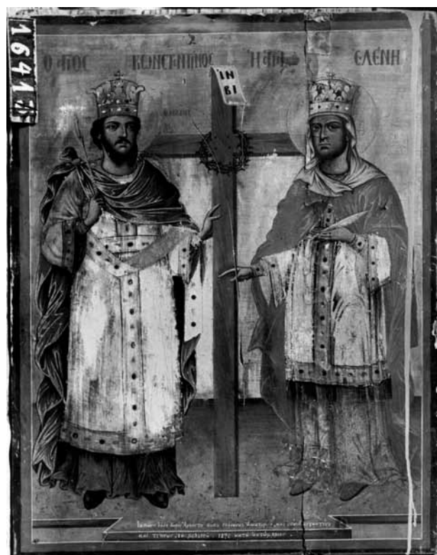
Сл. 12. Константин и Елена, црква Св. Преображение, Прилеп