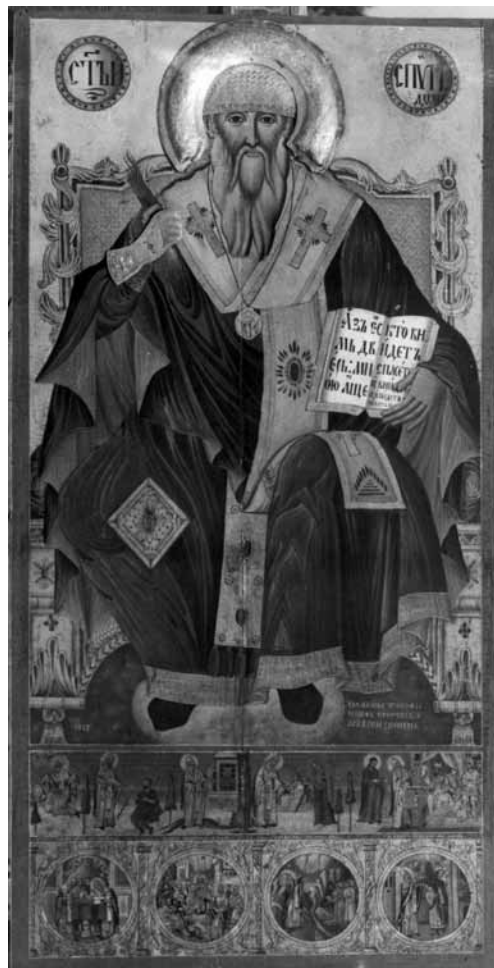
Сл. 2. Св. Спиридон, црква Св. Благовештение, Прилеп