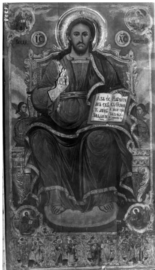
Сл. 6. Исус Христос, црква Св. Благовештение, Прилеп