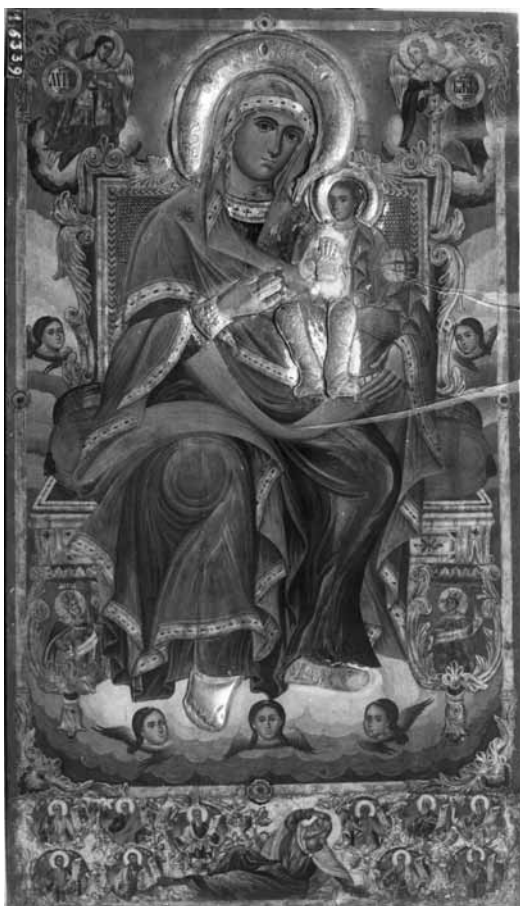
Сл. 5. Св. Богородица со Христос, црква Св. Благовештение, Прилеп