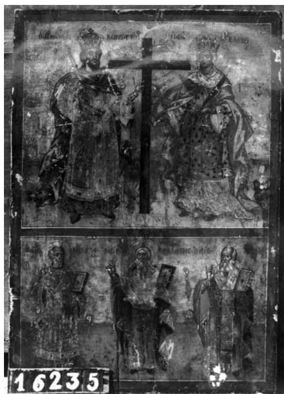
Сл. 11. Константин и Елена, црква Св. Благовештение, Прилеп